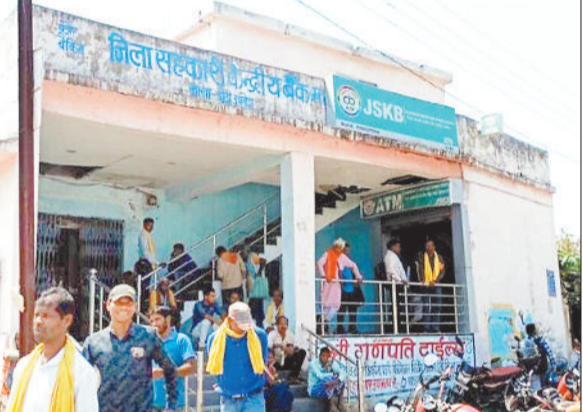
वह बैंक जहां से निकाली गई राशि।