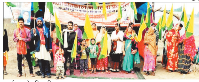
प्रदर्शन करते भूविस्थापित।

एसईसीएल गेवरा क्षेत्र के लिए अर्जित पाली अनुविभाग तहसील हरदीबाजार अंतर्गत जोकाहीडबरी अमगाव के प्रभावितों के मकानों व परिसम्पत्तियों का मुआवजा भुगतान नहीं किये जाने से पिछले तीन माह से आंदोलन किया जा रहा है। पाली एसडीएम द्वारा निजी भूमि को शासकीय भूमि दर्शाकर एसईसीएल को अपने पालिसी के अनुसार मुआवजा भुगतान करने संबंधी आदेश जारी होने पर पुनः कलेक्टर से शिकायत करते हुए मुआवजा भुगतान करने की मांग की गई है।