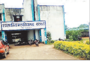
मुख्य परीक्षा का संचालन करवाते हैं और इसी संकुलर के हिसाब से परीक्षा में पर्यवेक्षक व अन्य कर्मचारियों की ड्यूटी लगाई जाती है लेकिन बरपाली का शासकीय महाविद्यालय अपने अलग ही नियमों से परीक्षा करवाने में लगा है। विश्वविद्यालय के संकुलर के अनुसार अगर महाविद्यालय में परीक्षा ड्यूटी के लिए पर्यवेक्षक की कमी है तो

बरपाली। शासकीय महाविद्यालय बरपाली में मुख्य परीक्षा में विश्वविद्यालय के नियमों को ताक में रखकर पर्यवेक्षक बनाये जा रहे हैं। जिसमें स्नातक के छात्रों से परीक्षा ड्यूटी कराने का मामला देखने को मिल रहा है।