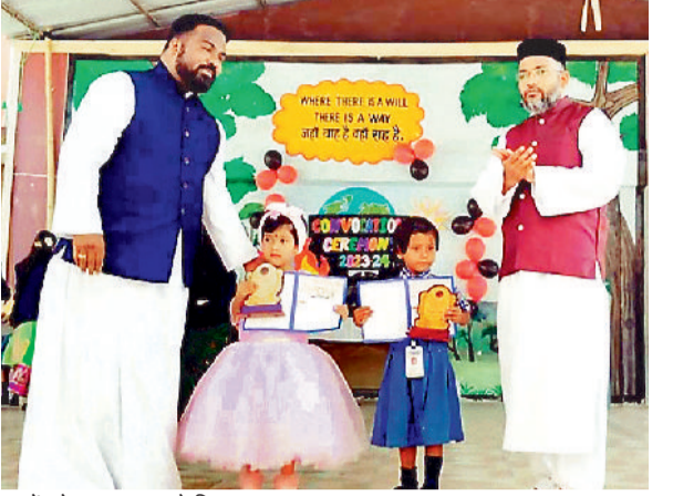
बच्चों को पुरस्कार करते शिक्षक।